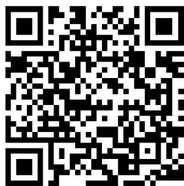
苹果 IOS 下载